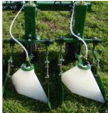
Hauben & Pflanzenschutzschilder