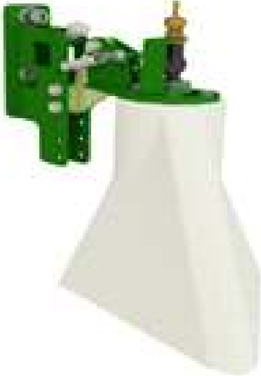
GW405-Haubenspritzen Einheit mit Befestigungen&Düsen

Getreide: wird ein großer, robuster Reifen empfohlen, um Unebenheiten auszugleichen und somit einen stabilen Einsatz zu garantieren.